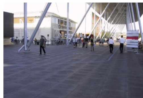
stabilisation de sol extérieur

Il se pose idéalement en quinconce ; laisser un vide de 1,5 cm minimum au droit des murs. Si besoin (trafic intense, installation à long terme), les tapis peuvent être collés entre eux ou vissés au support.