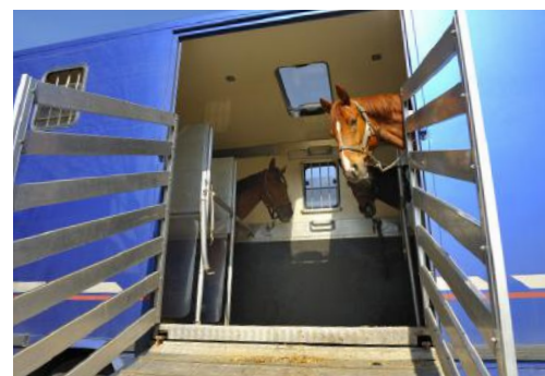
sol de van