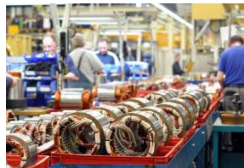
revêtement de sol d'atelier